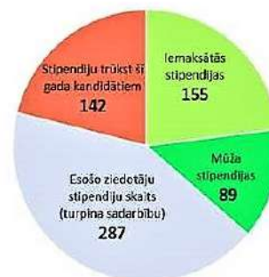
Kandidāti 2018-2019 mācību gadā KOPĀ PIETEICĀS 285 KANDIDĀTS